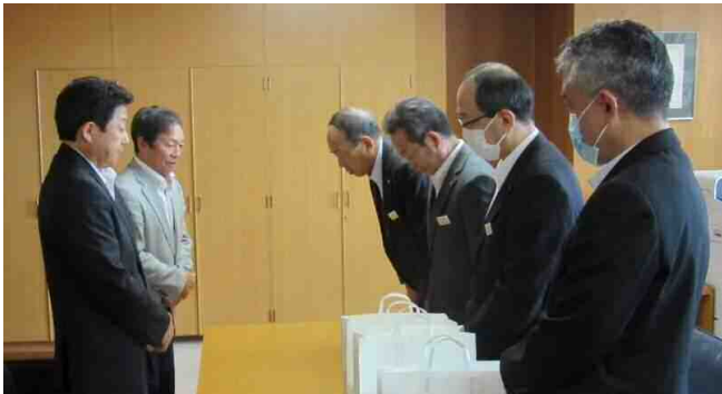
牛乳贈答券寄贈の様子

今回の牛乳贈答券の寄贈は、宗谷地区農業協同組合長会と宗谷地区農協酪農対策推進協議会の両組織により行われ、宗谷管内（幌延町を除く）の小中高生約5,370人を対象に、一人当たり1枚1リットルの券を2枚配布するというもので、新型コロナウイルスによる学校の休校で給食用牛乳の消費がほぼ無くなり、又、外出自粛に伴い飲食店等でも需要が落ち込んだことにより、牛乳消費拡大や健康増進、そして宗谷管内の酪農家を応援することを目的としております。