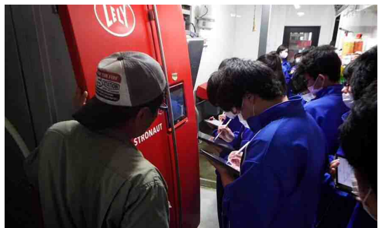
ファームAYNIの視察風景