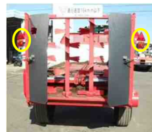
反射器及び車幅等（後部）