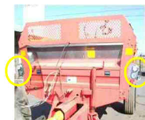
反射器及び車幅等（前部）

けん引式農作業機は農耕トラクターとは別の自動車として扱われますので、連結時に農耕トラクターの灯火器類が見えていても、けん引式作業機には、前面に車幅灯及び前部反射器（白色を、後面にテールランプ、ブレーキランプ、バックランプ、ウインカー及び後部反射器（赤色の正立正三角形）を 所定の位置に備える必要があります。