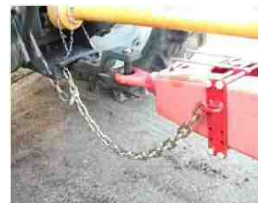
チェーン等をつなぐ

農耕トラクターとは別に農耕作業用トレーラーとしての保安基準を満たす灯火器類をけん引式農作業機の前面及び後面に備える必要があります。また、万が一意図せずに農耕トラクターとけん引式農作業機の連結装置が分離した時であっても連結を保てるように、農耕トラクターとけん引式農作業機をチェーン等の丈夫な装置でつなぐ必要があります。なお、けん引車は農耕トラクターに限られ、けん引式農作業機に積載可能な物品は農耕作業に必要なものに限られていますので、コンバイントレーラ等の汎用性が高いものは注意が必要です。