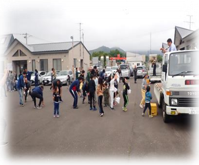
老若男女問わず大いに盛り 上がった餅まき風景

当日は、組合員(子供含め)115名、来賓等45名、総勢160人が一堂に会し、焼き肉などを囲みながら、お楽しみ抽選会に一喜一憂しながら歓声を上げ、最後は餅まきで限られたひと時を過ごしました。