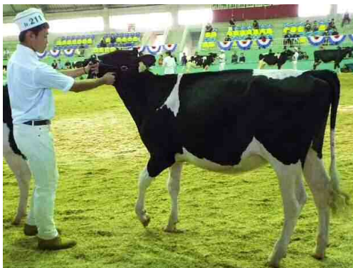
「ウチ アメイジング エリザベス チフ」