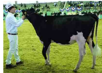
「ハッピーライン ジャコビー ラスター」