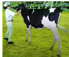
「マタドーア ドック ステラ」