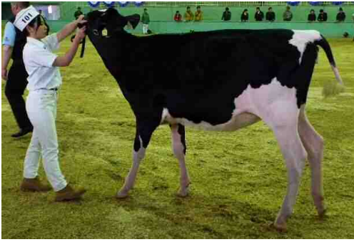
「オムラ ストーン ハート ブーティー」