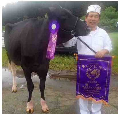
インターミディエイトチャンピオンに輝いた 「オムラ フジサン ブラック ET」