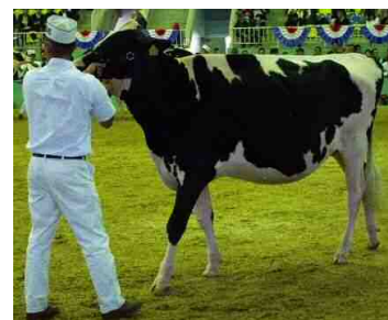
「ルージュモンテ キングスウエイ ドアマン ハピネス ET」