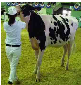
「オムラ MS エーデルワイス」