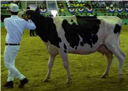
「オムラ ヒル アンドリユー」