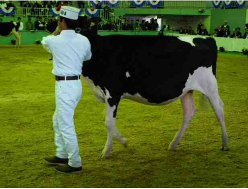
「マタドーア ジャコビー クレア」