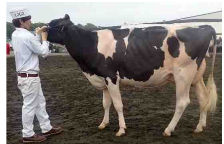
「HL エレガンス マウンテン シド」