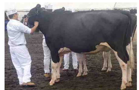
「ウチ プロフィット ソロモン マークイス」