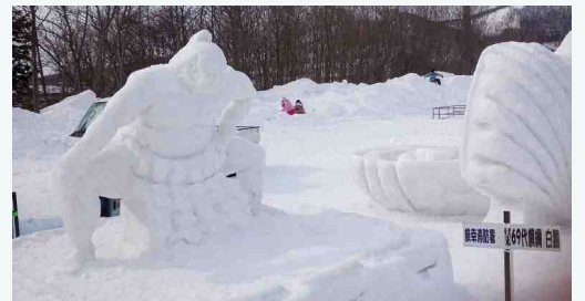
雪像コンテスト優勝作品の「白鷗」