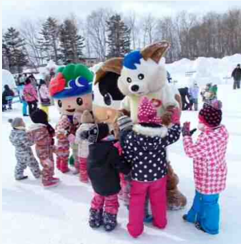
えさっしーとホクトくんも参加しました。