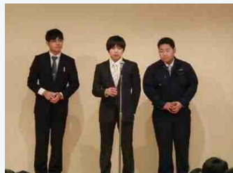
未年のルーキー3人衆