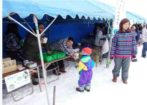
「いっぱい牛乳を飲んでね」と呼びかけながら牛乳を配っていました。